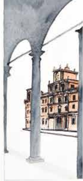
Opera di Giuliano Della Casa. Art Piece by painter Giuliano Della Casa