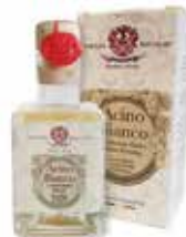
ACINO BIANCO Acino Bianco